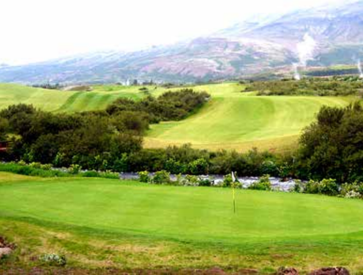
Geysir Golf Club Golfplatz 4

Geysir Golf Club ist der einzige Golfkurs auf Island, bei dem an einem aktiven Geysir abgeschlagen werden kann. Der Kurs wurde im Jahr 2006 eröffnet und von Golfarchitekt Edwin Roald gestaltet. Weniger als einen Drive vom Clubhaus entfernt, befindet sich ein Geysir der in regelmäßigen Abständen kochendes Wasser in den isländischen Himmel schießt. Von Buschwerk und Flussläufen eingebettete Fairways, schmiegen sich an die sonst unberührte Natur und geben dem Platz das typische Erscheinungsbild eines Linkskurses.