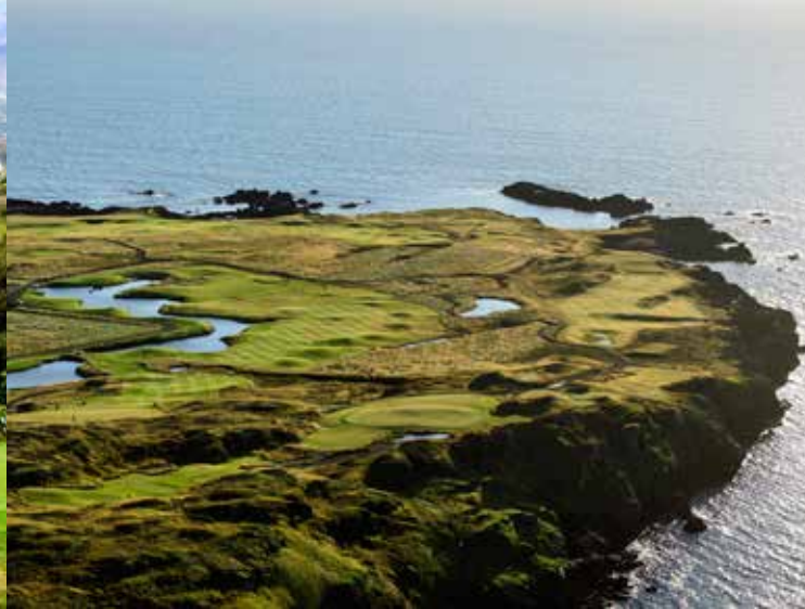
Brautarholt Golf Club, Brautarholt Golf Course Golfplatz 5

18-Loch-Platz, Par 74, 6.070 m www.geysirgolf.is