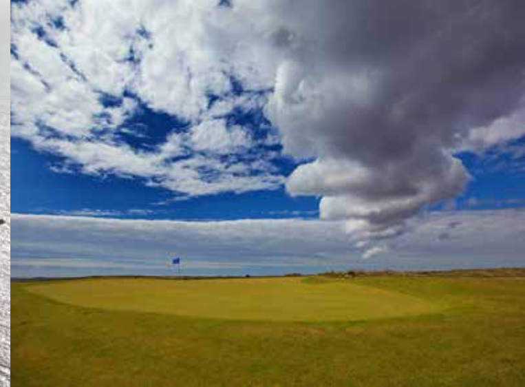
Grindavik Golf Club, Grindavik Golf Course Golfplatz 6

18-Loch-Platz, Links, Par 68, 5.292 m Designer: Michael Kelly www.gbr.is/en