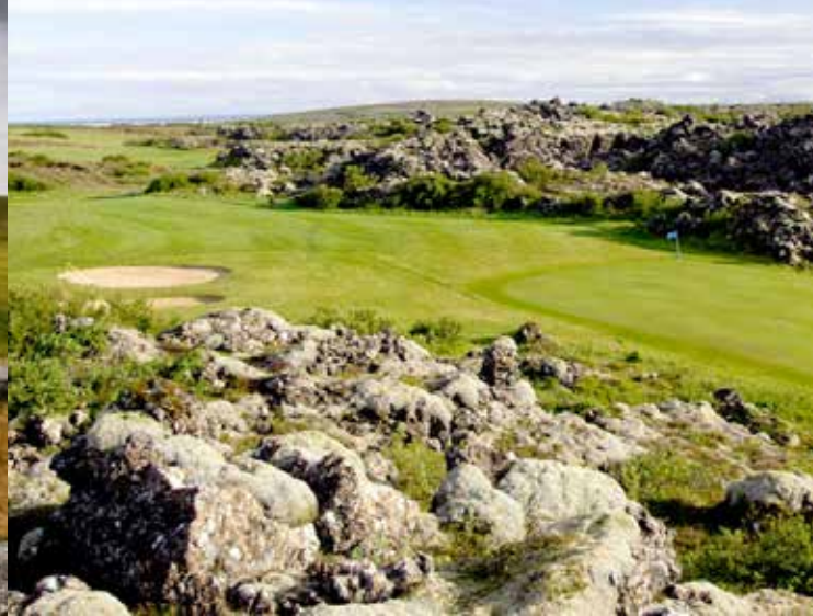
Oddur Golf Club, Oddur Golf Course Golfplatz 2

18-Loch-Platz, Links, Par 71, 5.405 m Designer: Nils Skjöld www.english.keilir.is