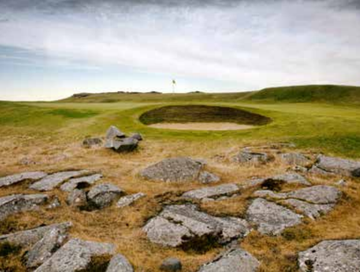
Keilir Golf Club, Keilir Golf Course Golfplatz 1

Der Keilir Golf Club wurde im Jahr 1967 gegründet und ein ehemaliger Landesmeister designte dort den ersten 9-Loch-Golfplatz. Im Jahr 1971 gewann der Verein den schwedischen Golfdesigner Nils Skjöld, um einen neuen 12-Loch-Golfplatz auf der Halbinsel zu entwerfen. Der Bau der neuen vorderen 9 im Lavafeld wurde im Jahr 1997 abgeschlossen und seitdem ist der Keilir GC ein 18-Loch-Golfplatz. Der Kurs befindet sich derzeit unter den Top 100 Golfplätzen in Europa und gilt eindeutig als der beste Golfplatz des Landes.