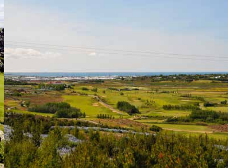
GKG Golf Club, GKG Golf Course Golfplatz 3

18-Loch-Platz, Par 71, 5.859 m www.oddur.is/EN