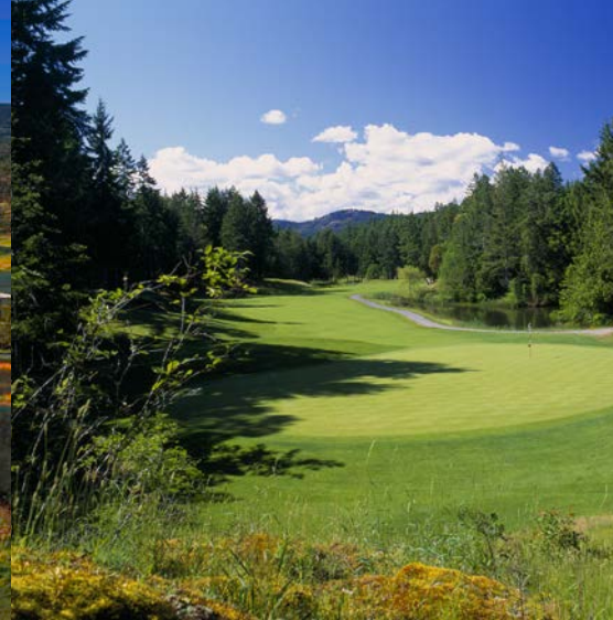
Olympic View Golf Club, Victoria Golfplatz 7

18-Loch-Platz, Par 72, 6.296 m Designer: Nicklaus & O'Leary www.okanagangolfclub.com/golf_course/bear