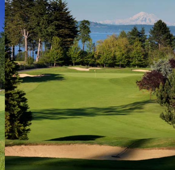
Cordova Bay Golf Club, Victoria Golfplatz 8

18-Loch-Platz, 72 Par, 6.035 m Designer: Bill Robinson www.golfbc.com/courses/olympic_view