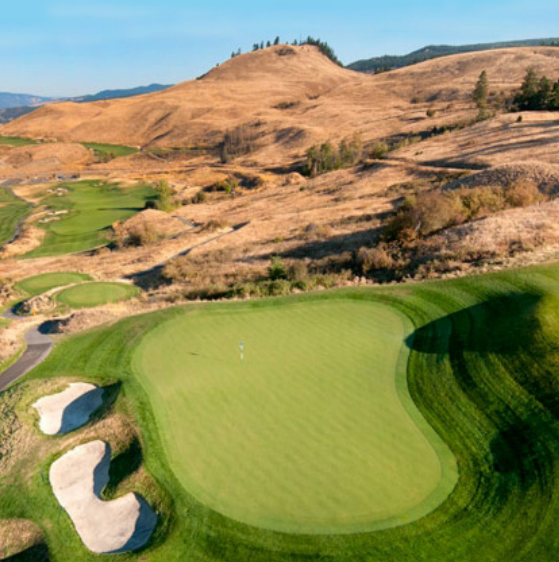
Tower Ranch Golf and Country Club, Kelowna | Golfplatz 5

Spektakuläres Design! Der Tower Ranch Golf and Country Club bietet durch seine Lage am Hang über Kelowna, faszinierende Ausblicke auf die Stadt und den Okanagan Lake. Eines der eindrucksvollsten Golf-Erlebnisse West Kanadas, geplant von Thomas McBroom. Wenn Sie diesen Platz einmal gespielt haben werden Sie es kaum erwarten können ein weiteres Mal hier abzuschlagen.