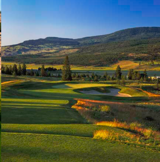
Okanagan Golf Club - The Bear Golfplatz 6

18-Loch-Platz, Par 72, 6.595 m Designer: Thomas McBroom www.golftowerranch.com/-course-overview