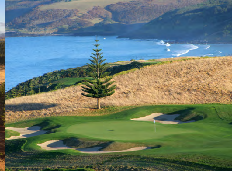
Kauri Cliffs Golf Course Golfplatz 9

18-Loch, 72 Par Designer: Coore & Crenshaw www.tearai.com