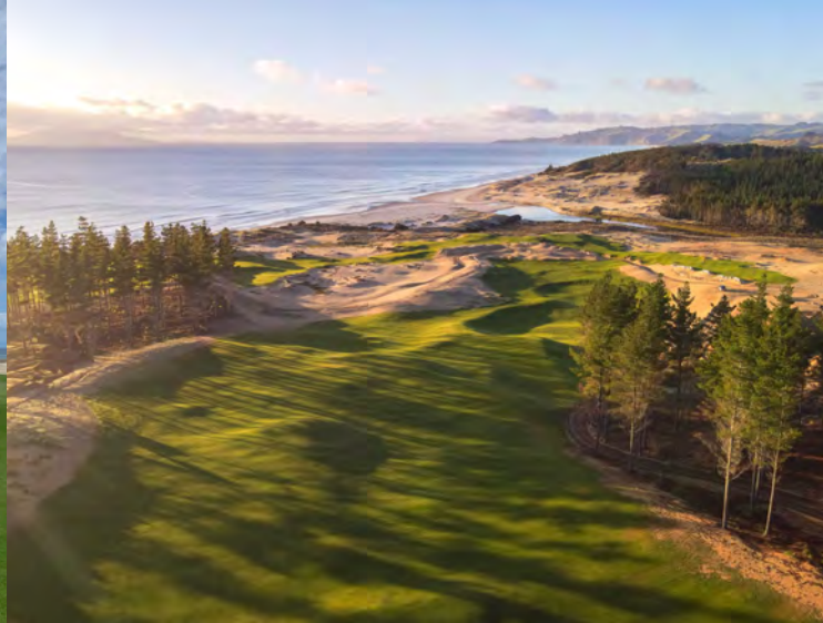
Te Arai South Course Golfplatz 8

18-Loch, 72 Par Designer: Tom Doak www.tearai.com