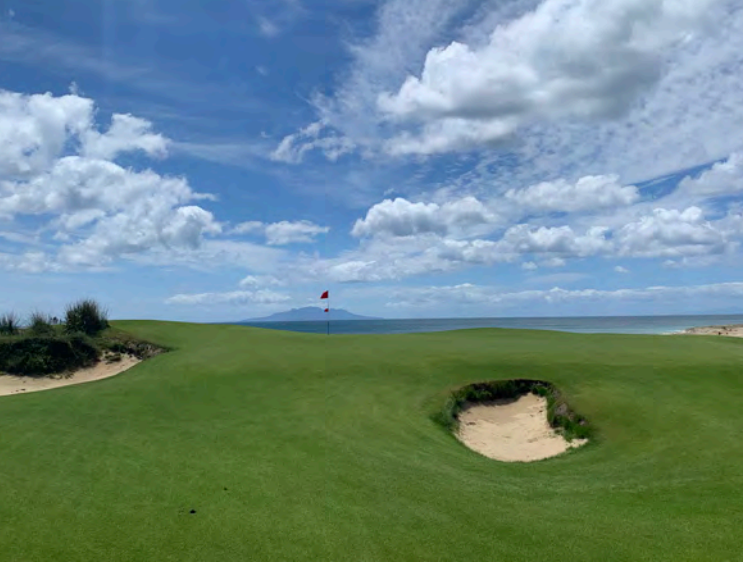
Te Arai North Course Golfplatz 7

Kein geringere als Tom Doak ist aktuell mit der Fertigstellung (Eröffnung Oktober 2023) des North Course in vollem Gange, der mit 12 Löchern, die Meerblick bieten, optisch so atemberaubend wie der South Course zu werden verspricht. Schrullige, einzigartige Golfplätze nutzen die einheimische Landschaft mit wogenden Sandkämmen und gewundenen Fairways..